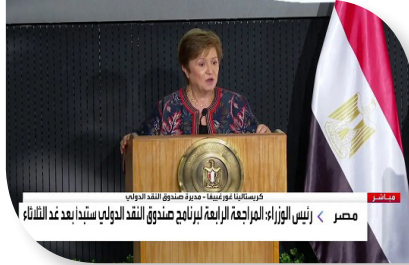
مصر < رئيس الوزراء المراجعة الرابعة لبرنامج صندوق النقد الدولي سبباً بعد عد الأثناء كريستالينا جورجيفا - مديرة صندوق النقد الدولي

أكدت مديرة صندوق النقد الدولي، كريستالينا جورجيفا، أن مصر أظهرت قوة غير مسبوقة خلال هذا الوقت غير المسبوق في المنطقة. والتقت جورجيفا الرئيس المصري عبد الفتاح السيسي، كما التقت رئيس مجلس الوزراء مصطفى مدبولي، حيث أوضحت في مؤتمر صحفي بمقر مجلس الوزراء المصري بالعاصمة الإدارية، أن الإصلاح الاقتصادي صعب، لكن نتائجه اقتصاد أقوى لمصر. وأشارت إلى تراجع التضخم في مصر مع خطط للوصول إلى 16% نهاية العام. وأبرزت أن التضخم في مصر يتراجع لـ 26% وهناك اتجاه لخفضه إلى 16% بنهاية العام المالي.